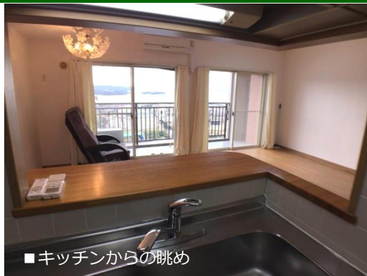
■キッチンからの眺め