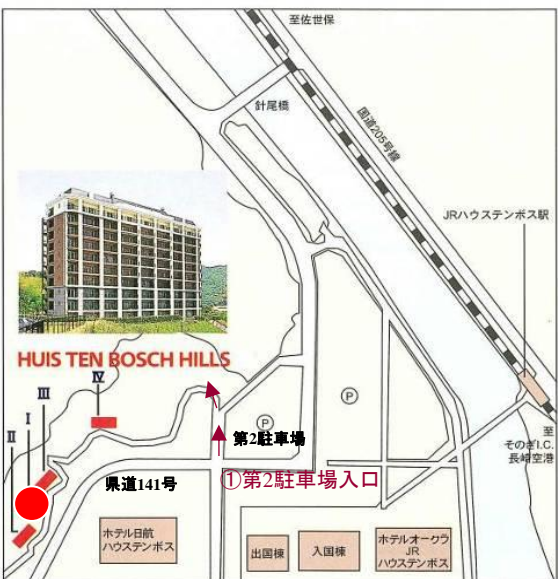
②至 グリーンメイク事務所入口方面

県道141号線より、①第2駐車場入口、②グリーンメイク事務所入口どちらからでも車で登って行けます。