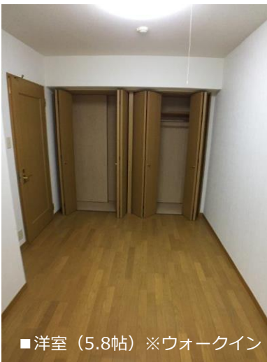
■洋室 (5.8帖) ※ウォークイン