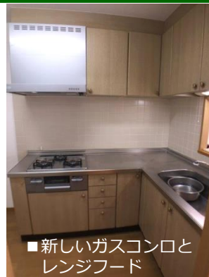
■新しいガスコンロとレンジフード