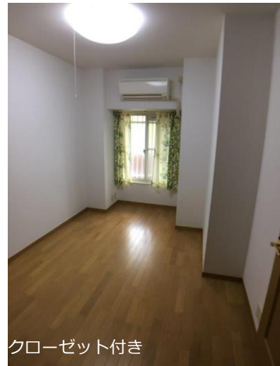
クローゼット付き