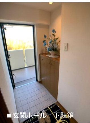
■ 玄関ホール、下駄箱