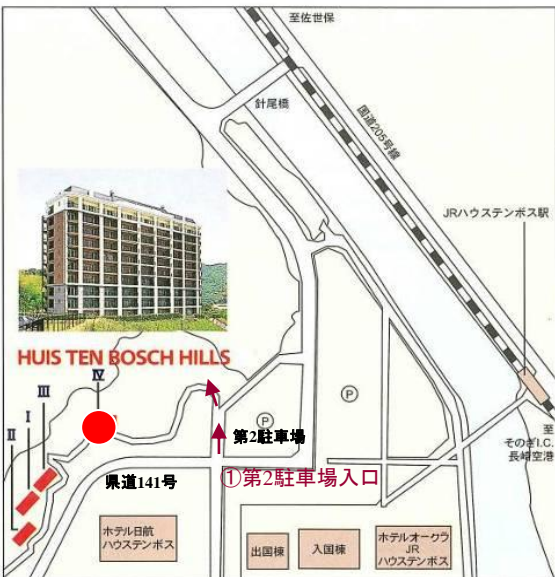
②至 グリーンメイク事務所入口方面

県道141号線より、①第2駐車場入口、②グリーンメイク事務所入口どちらからでも車で登って行けます。