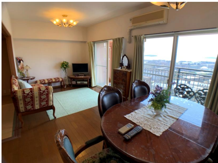
▲ダイニング (丁度良い高さで眺望が楽しめます ^^ !)