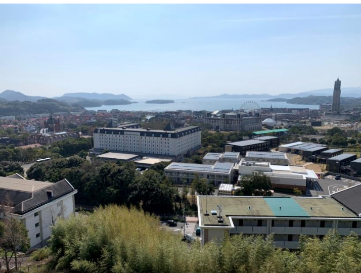
▲バルコニーからの眺望 ※実際には防鳥ネットがございます