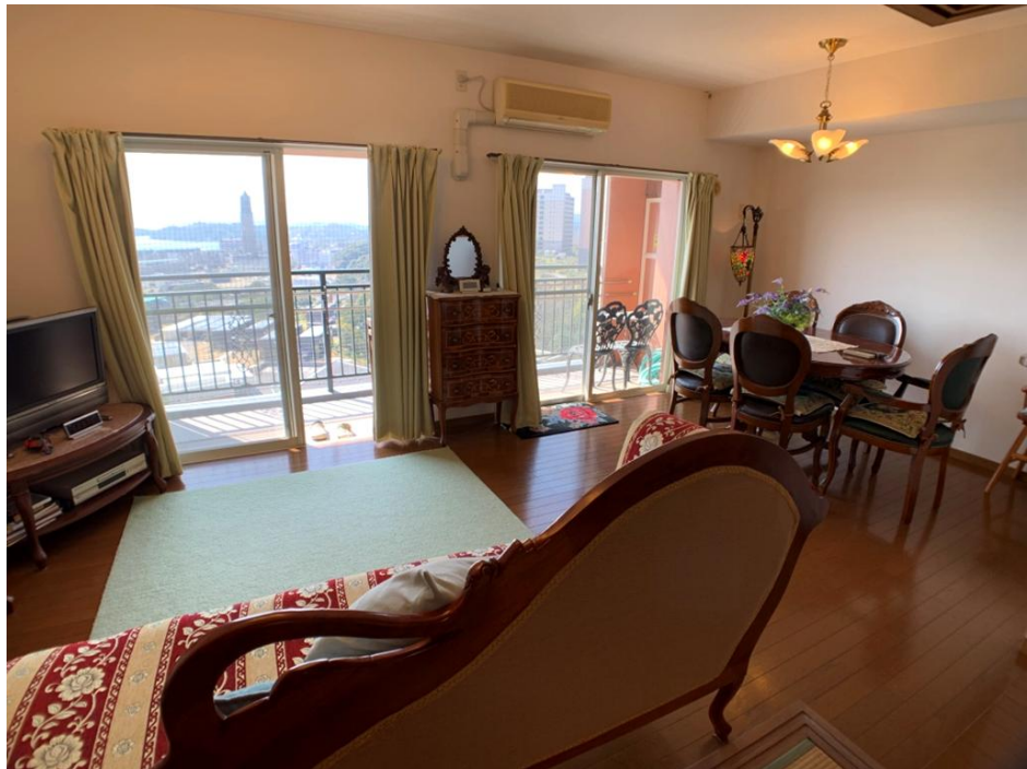
▲リビング・ダイニングルーム (約11.6帖)