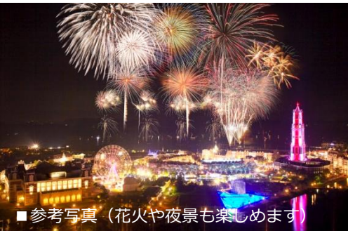
■参考写真 (花火や夜景も楽しめます)