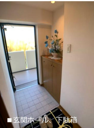
■玄関ホール、下駄箱