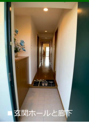
■玄関ホールと廊下