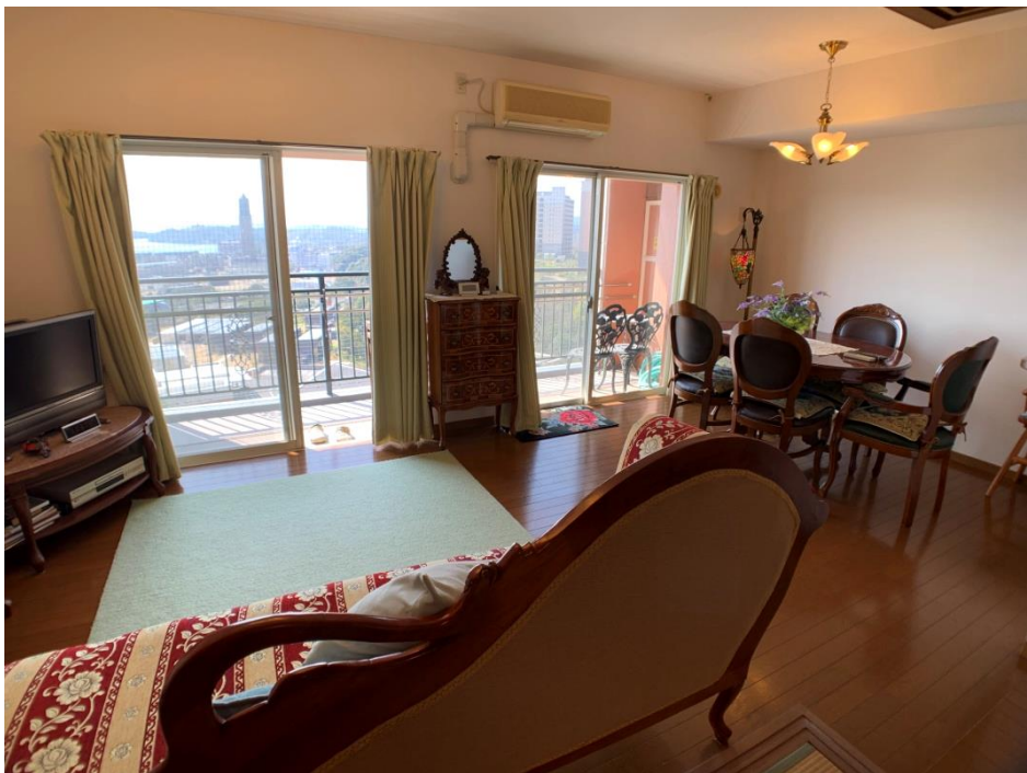
▲リビング・ダイニングルーム (約11.6帖)