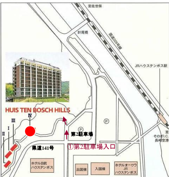
②至 グリーンメイク事務所入口方面

県道141号線より、①第2駐車場入口、②グリーンメイク事務所入口どちらからでも車で登って行けます。