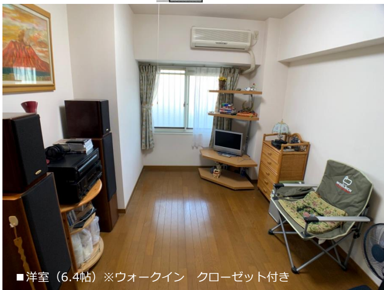
■洋室 (6.4帖) ※ウォークイン クローゼット付き