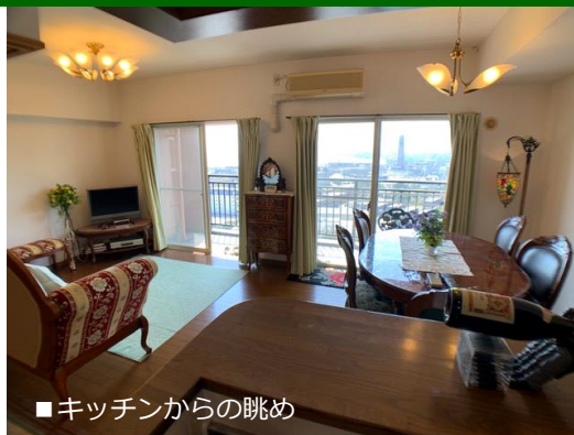
■キッチンからの眺め