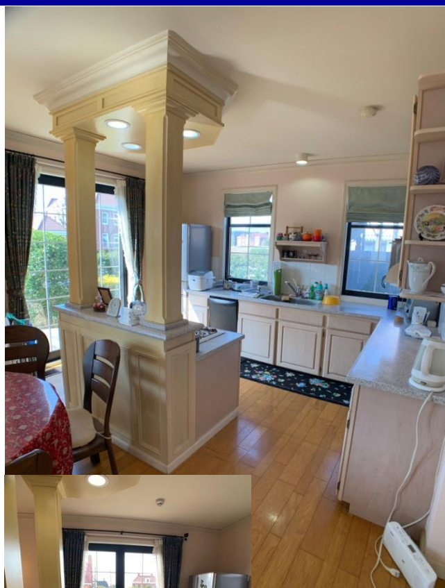
■開放的なキッチン