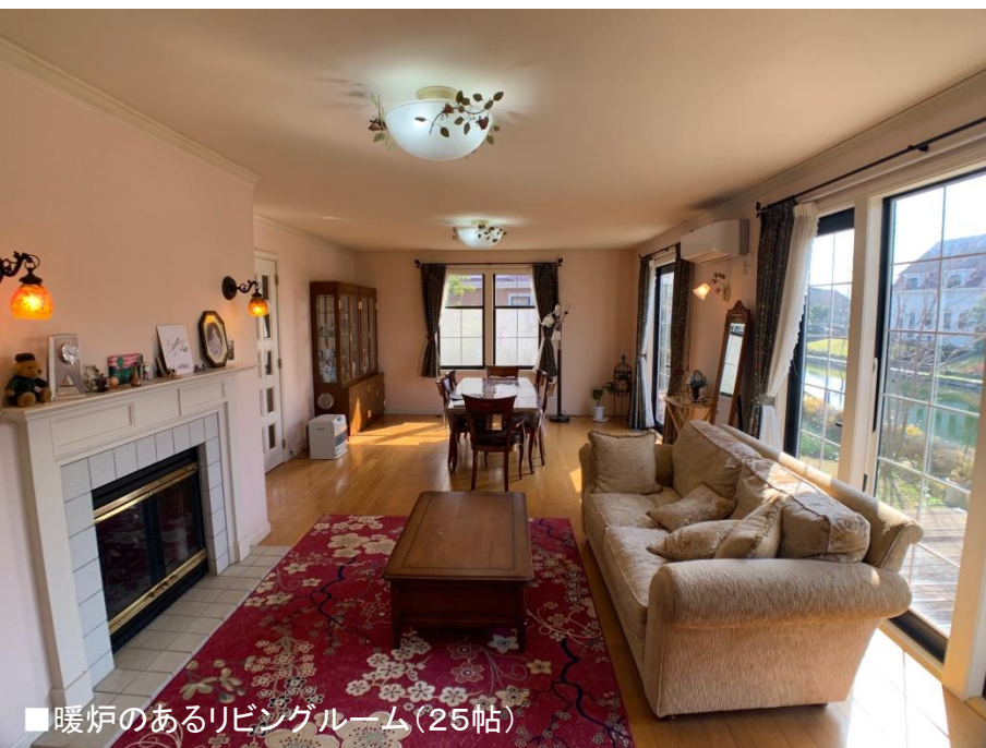
■暖炉のあるリビングルーム(25帖)