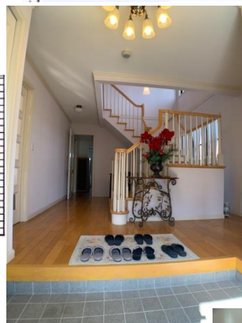
■玄関ホールと階段部(吹き抜け)