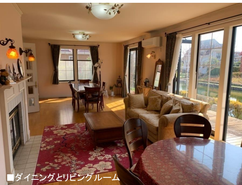
■ダイニングとリビングルーム