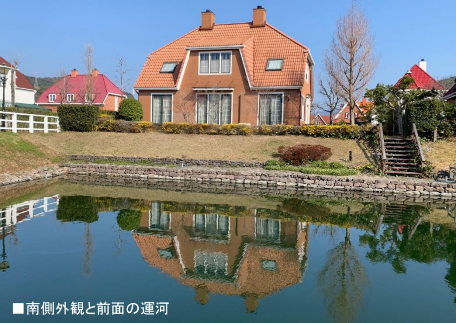
■南側外観と前面の運河