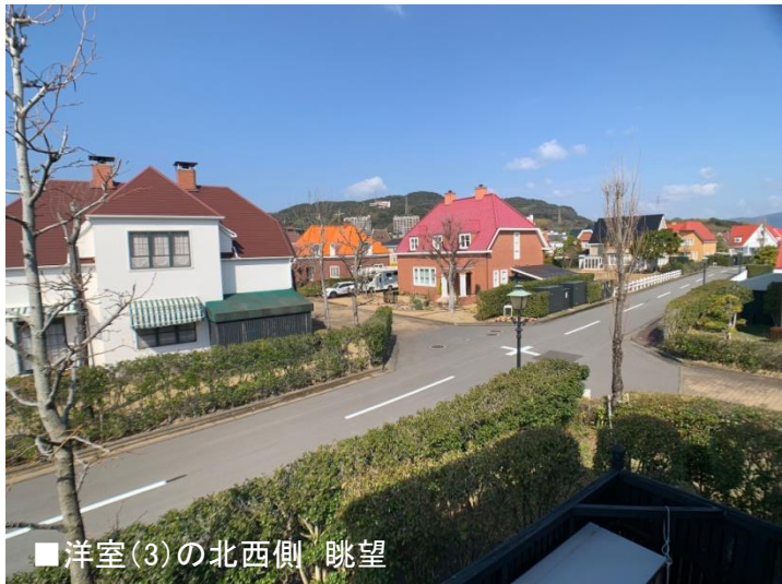
■洋室(3)の北西側 眺望