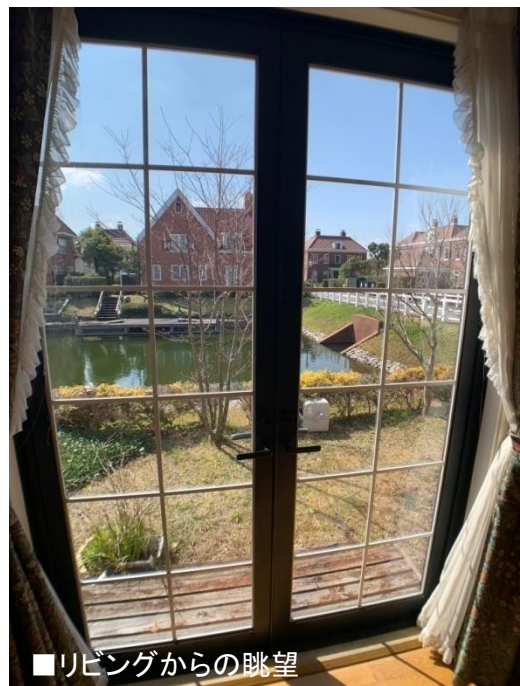
■リビングからの眺望