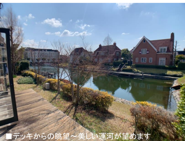
■デッキからの眺望～美しい運河が望めます