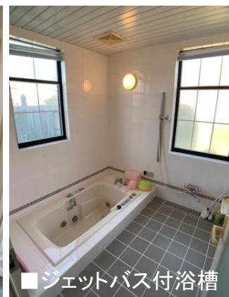
■ジェットバス付浴槽