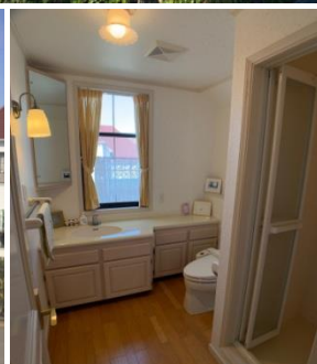
2階の洗面・シャワー・トイレ