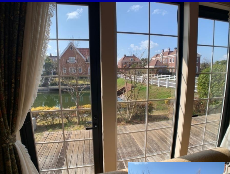
■リビング前のウッドテラス