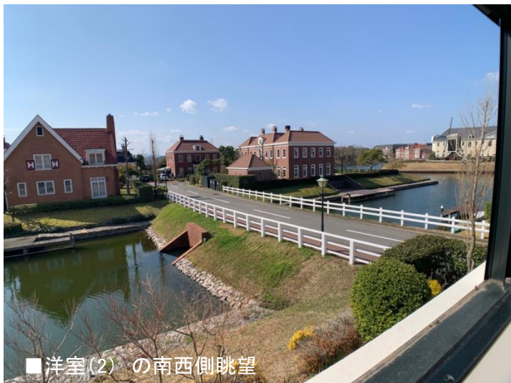
■洋室(2) の南西側眺望