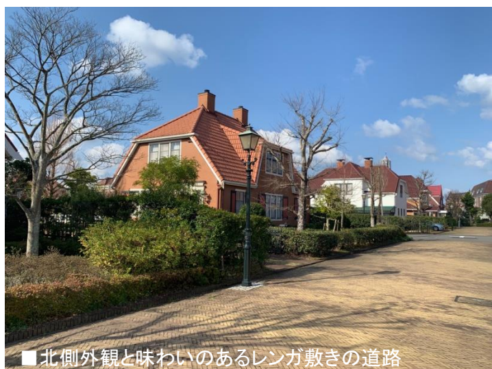
■北側外観と味わいのあるレンガ敷きの道路