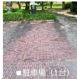
■ 駐車場 (1台)