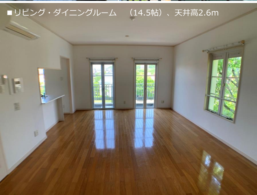
■リビング・ダイニングルーム（14.5帖）、天井高2.6m