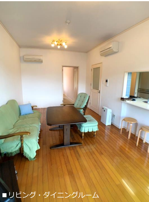
■リビング・ダイニングルーム