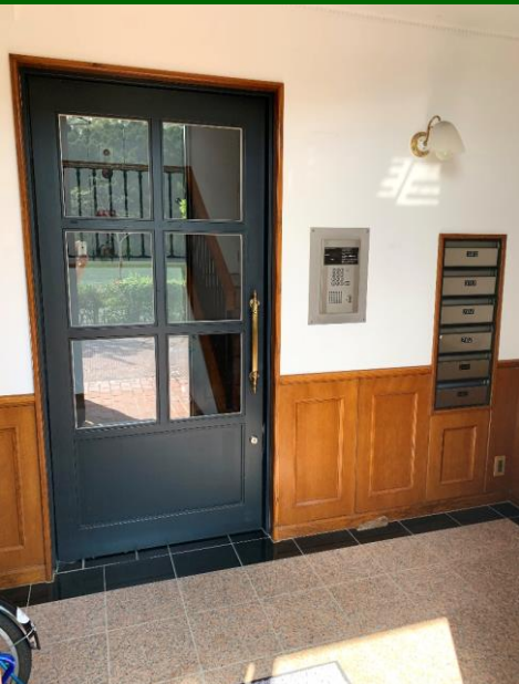
■ 共用エントランスとインターホン