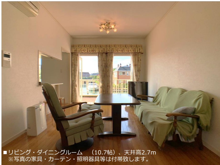
■リビング・ダイニングルーム (10.7帖)、天井高2.7m ※写真の家具・カーテン・照明器具等は付帯致します。

■リビング・テラスからの眺望 広いテラスの先には、美しい運河と戸建ての街並みが広がります。