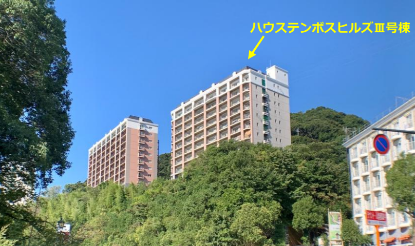
ハウステンボスヒルズⅢ号棟